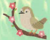
参加者の作品で～す。