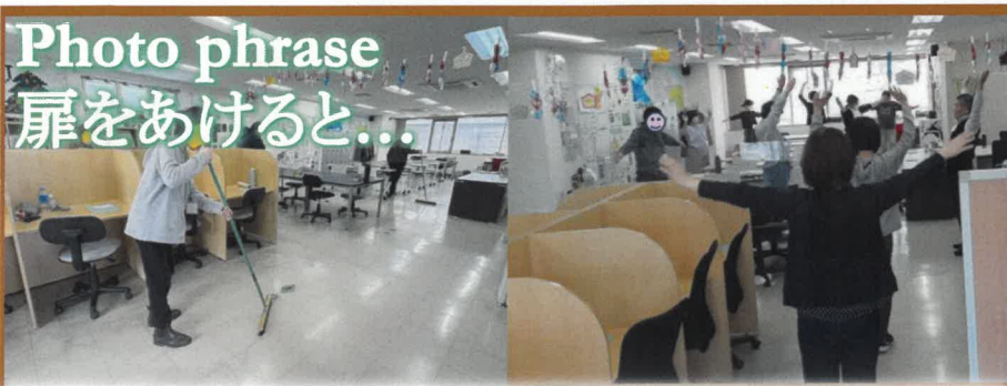
Photo phrase 扉をあけると...