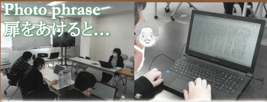
Photo phrase 扉をあけると...